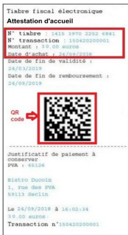
Exemple de ticket buraliste