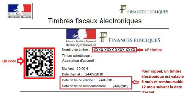
Exemple de timbre

Ces informations figurent sur le justificatif d'achat du timbre par internet ou sur le ticket d'achat du buraliste.